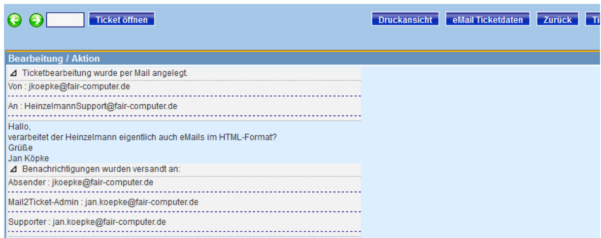
Abbildung 4: generierte Ticketbearbeitung

Werden durch den Dienst Benachrichtigungen versandt (siehe Abschnitt 5), werden die Empfänger ebenfalls in solch einer Zeile unterhalb der Ticketbearbeitung angezeigt: